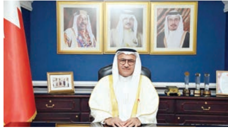
○ محافظ الشمالية.

إلى مستويات متقدمة، مشيراً إلى أن مملكة البحرين تتمتع بمنظومة صحية متطورة، بفضل الاستراتيجيات الحكيمة المنبثقة من الرؤية الملكية الثاقبة، التي تجلت بشكل واضح خلال التعامل مع جائحة كورونا، حتى نالت مملكة البحرين الإشادة الدولية والمحلية في تجربتها الفريدة في إدارة أزمة كورونا، وذلك يجعل صحة الإنسان أولوية، بالإضافة إلى توفير الحكومة الخدمات الصحية المتكاملة من فحص وعلاج وتطعيم ورعاية طبية مجانية متاحة وقريبة للجميع على قدم المساواة، مقدماً شكره وتقديره إلى وزيرة الصحة الأستاذة فائقة بنت سعيد الصالح، وجميع منتسبي وزارة الصحة، ومكتب المدن الصحية بالوزارة، على جهودهم ومتابعاتهم طوال