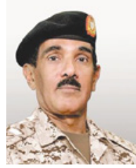
فائد مستشفى الملك حمد

قال قائد مستشفى الملك حمد الجامعي اللواء طبيب الشيخ سلمان بن عطية الله آل خليفة أن وحدة الأشعة التداخلية بالمستشفى قد بدأت في استقبال وعلاج حالات نزيف البواسير بالقسطرة العلاجية، وهي تعد من أحدث الوسائل المبتكرة في علم الأشعة التداخلية والتي أصبحت متاحة حالياً بالمستشفى. وأشار أن هذه التقنية حققت نتائج مذهلة في علاج الكثير من الحالات التي تم استقبالها في المستشفى، مؤكداً أن مستشفى الملك حمد الجامعي سيقا دائماً في نقل وتطبيق أحدث البروتوكولات والتقنيات في العلاج بهدف تقديم أفضل الخدمات الطبية لجميع المواطنين والمقيمين بالمملكة. وأفاد الدكتور وائل إبراهيم استشاري ورئيس قسم الأشعة بمستشفى الملك حمد الجامعي أنه حسب الدراسة الحديثة أصبح من الممكن تعريف البواسير الشرجية على أنها الأوعية الدموية الملتحمة والمتفتحة الموجودة إما حول فتحة الشرج أو في الجزء السفلي من المستقيم، حيث يتم تروية هذه الأوعية الدموية من خلال شريان المستقيم العلوي والذي ينقسم إلى أربعة شرايين بحيث يقوم كل واحد منهما بتغذية منطقة محددة من هذه الأوعية الدموية، وفي حال حدوث نزيف فإن مصدر هذا النزيف يكون من خلال هذه الشرايين المغذية، مفيداً أن هذه