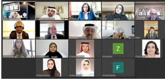
جانب من اجتماع صندوق الضمان الصحي «شفاء»