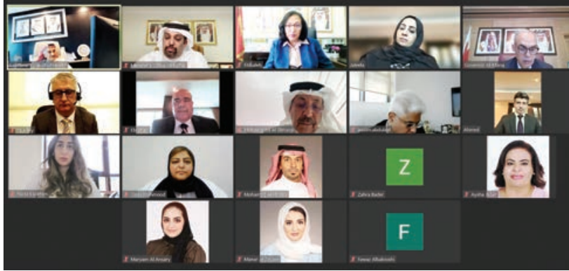
○ اجتماع صندوق الضمان الصحي.